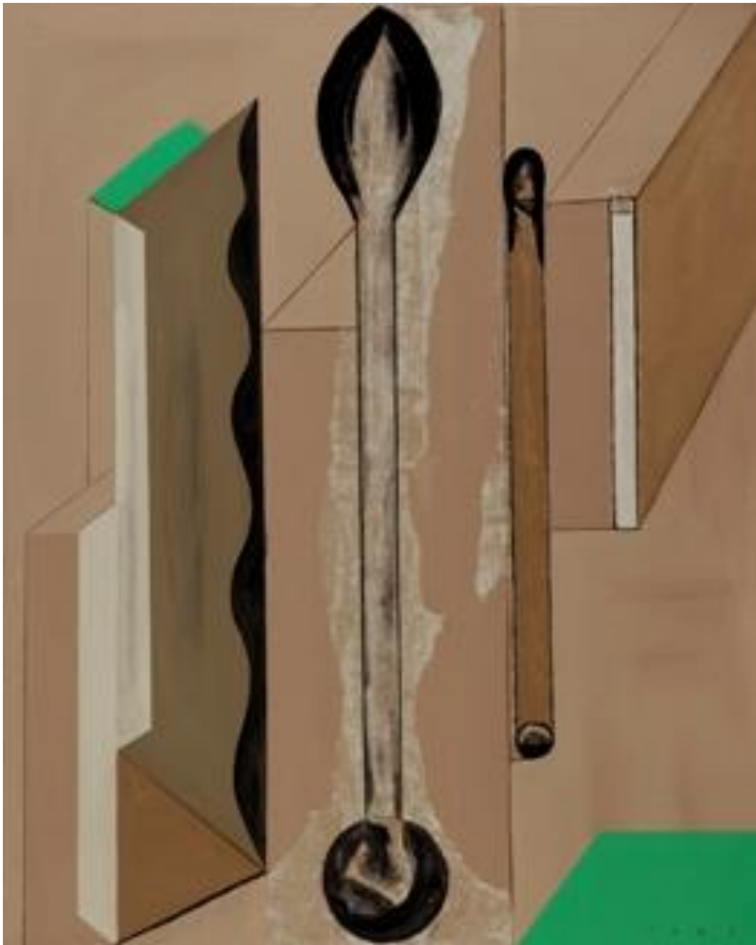
José Fors. Falsas Herramientas, 100 x 140 cm, 2005